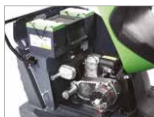
DUAL POWER (PARA 1050DP)