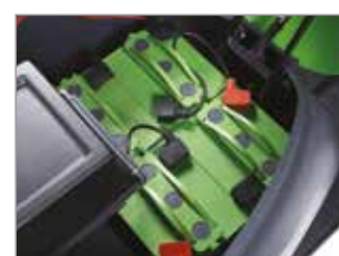
ALOJAMIENTO DE BATERÍAS (PARA 1050 E)